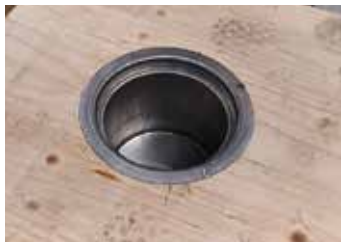
1. Golvbrunn installerad