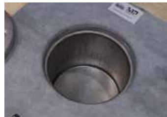
9. Brunnan är installerad med tätskikt och klämring.