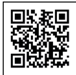
Scanna QR-koden för installationsvideo.