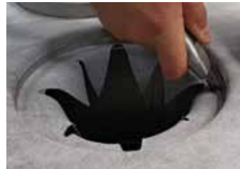
8. Skär bort överflödet av tätskikt