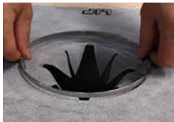
5. Placera klämringen.