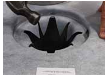
7. Slå fast klämringen. Slå med bestämda slag på expansionskarven. Vid behov, justera klämring med silen.