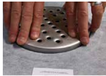
6. Pressa ner klämringen med hjälp av silen.