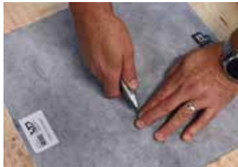
3. Håltagning av tätskikt. Placera 2 fingrar från kanten av brunnens innansida och skär 2 stk kryss.