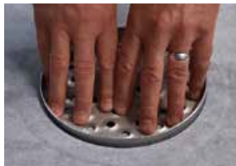
4. Tryck ner silen, upp och ner för att forma tätskiktsduken.